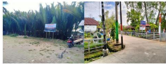
Gambar .4.3 Area Pohon Nipa-Nipa