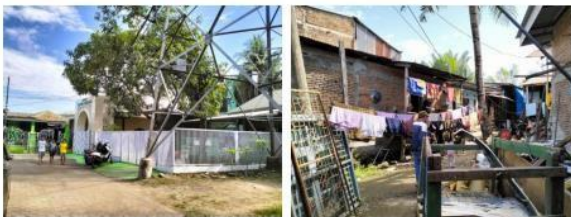
Gambar 4.1 Pemukiman Penduduk & Fasilitas Umum (Masjid) Yang Berada dalam Areal Sempadan Sungai