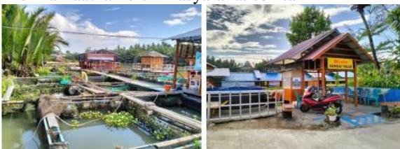
Gambar .4.2 Keramba Apung, Rumah Makan & Cafe