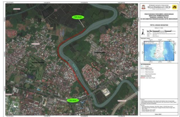
Gambar 1.1. Lokasi rencana pembangunan Tanggul sungai Tallo

Dinas Pekerjaan Umum Kota Makassar merencanakan Pembangunan Tanggul Sungai Tallo Di Kelurahan Panaikang dan Kelurahan Tello Baru, Kota Makassar. Panjang tanggul yang direncanakan adalah \pm 975 m dan pada lokasi yang sama akan dibangun jalan inspeksi dengan lebar 8 m dan 2 meter pedestrian. Bangunan tanggul ini diharapkan bisa mengurangi banjir di sepanjang lokasi kegiatan.