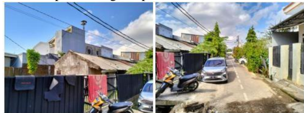
Gambar .4.4 Perumahan Citra Tallo Mandiri

Data primer akan diperoleh dengan melakukan wawancara kepada penduduk (responden) yang bermukim di sekitar lokasi rencana pembangunan tanggul sungai tallo yaitu di Kelurahan Panaikang dan Kelurahan Tello Baru. Penentuan responden dilakukan dengan menggunakan metode Purposive sampling yaitu dengan menunjukan langsung responden yang akan diwawancarai dengan mempertimbangkan :