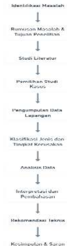
Gambar 2. Alur Penelitian