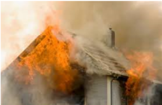
Gambar 1. Kebakaran Akibat Korsleting Listrik

Objek studi kasus dalam penelitian ini adalah sebuah bangunan komersil berlantai dua yang berlokasi di Kabupaten Pangkep yang mengalami kebakaran hebat pada tahun 2025. Bangunan tersebut berfungsi sebagai pusat perbelanjaan yang terdiri dari berbagai unit toko, fasilitas umum, dan area servis. Lokasi ini dipilih karena tingkat kerusakan yang signifikan serta aksesibilitas untuk dilakukan dokumentasi dan analisis langsung di lapangan.