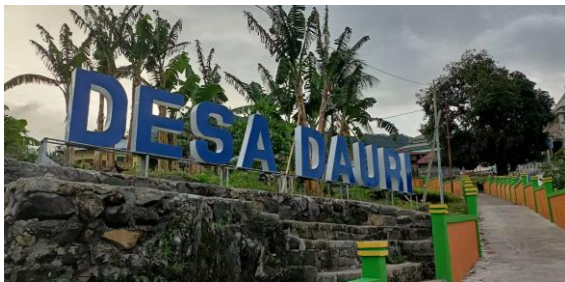
Gambar 1. Papan nama Desa Dauri