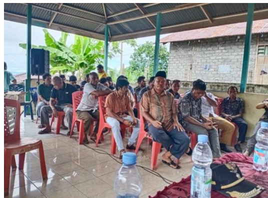
Gambar 2. Pelaksanaan PKM hari kedua