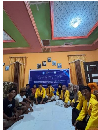
Gambar 2. Pelaksanaan PKM hari pertama